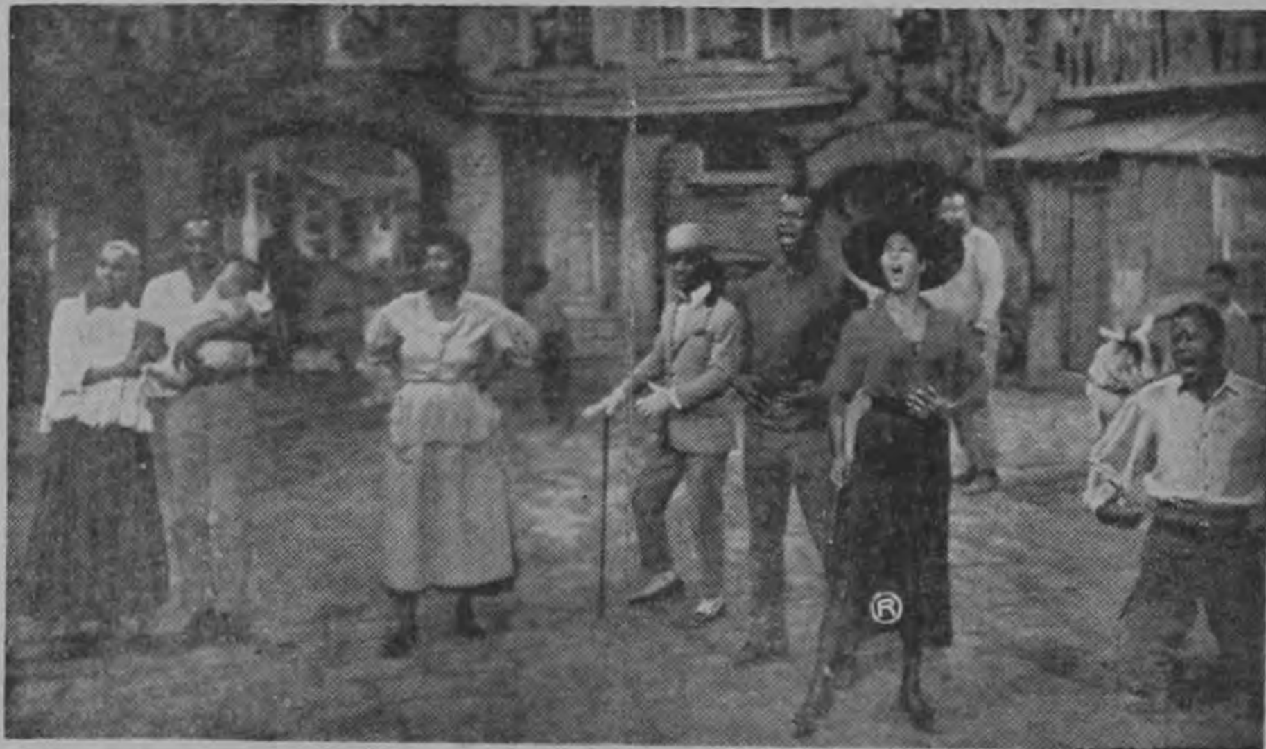
Una escena de la obra musical de George Gershwin "Porgy and Bess."

"Al presentar "Porgy and Bess" en película cinematográfica, he llenado uno de los más caros sueños alimentados durante muchos años. Ello es además, mi tributo personal a la memoria de George Gershwin, el más grande compositor de América.