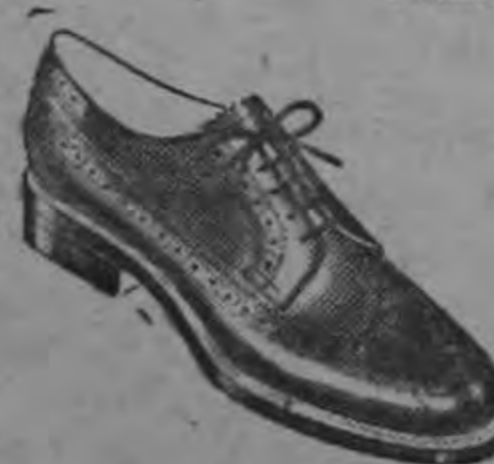
Para escolares ¢ 20.00