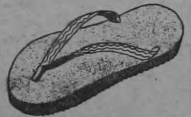
Playeras para señoras ¢ 11.00