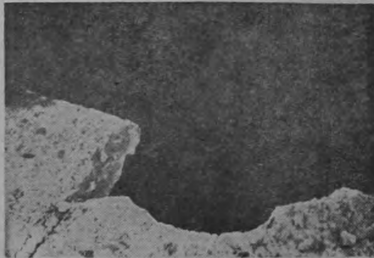
Parte del grueso pavimento de la carretera destruido por las enormes piedras y trepidación.

En Cartago, regiones cercanas al volcán y aun en esta misma ciudad hay alarma por lo que ocurre pues no se puede vaticinar en qué puede concluir