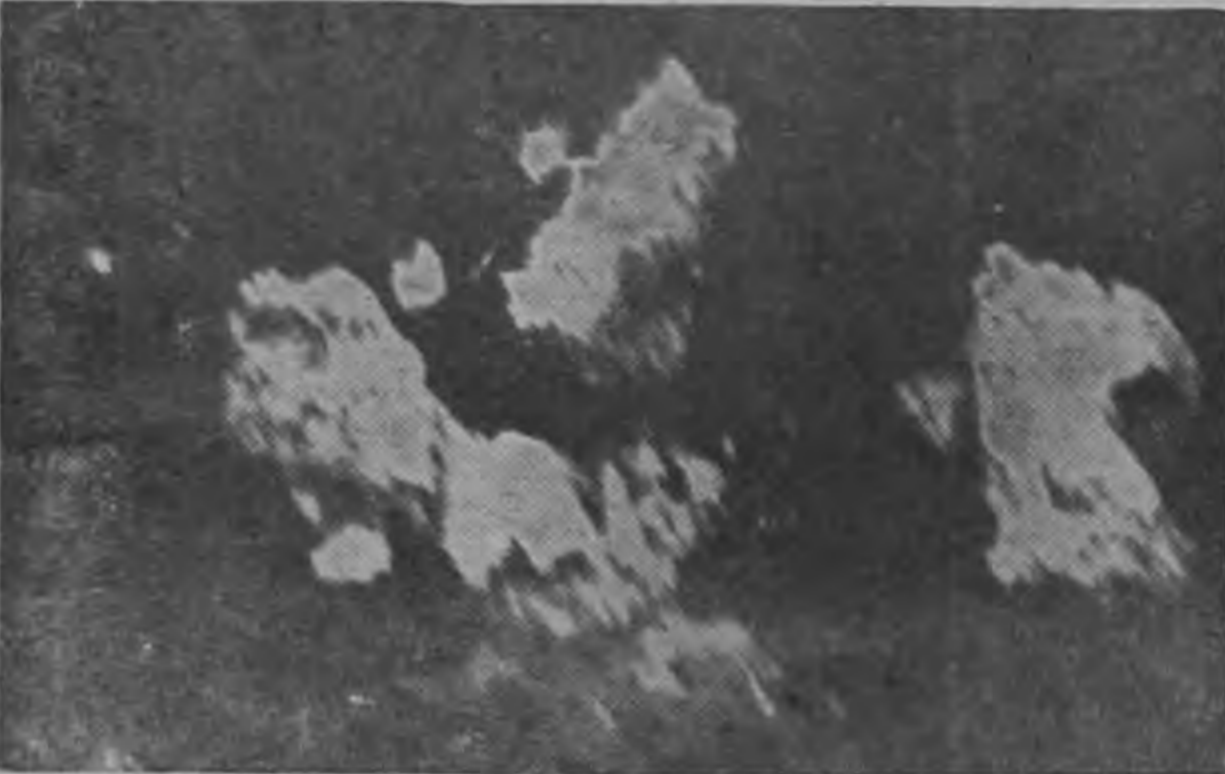
Piedras captadas por nuestro fotógrafo Valenzuela en el momento que lanzadas por la violenta erupción caían sobre los arrabanes, cerca de donde se encontraba.