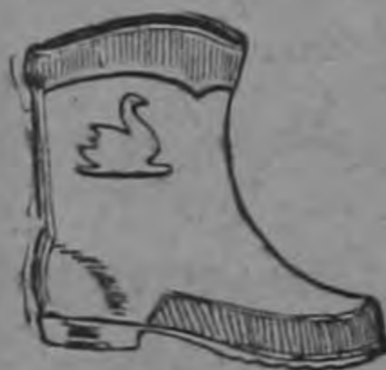
PATITO ¢ 10.00