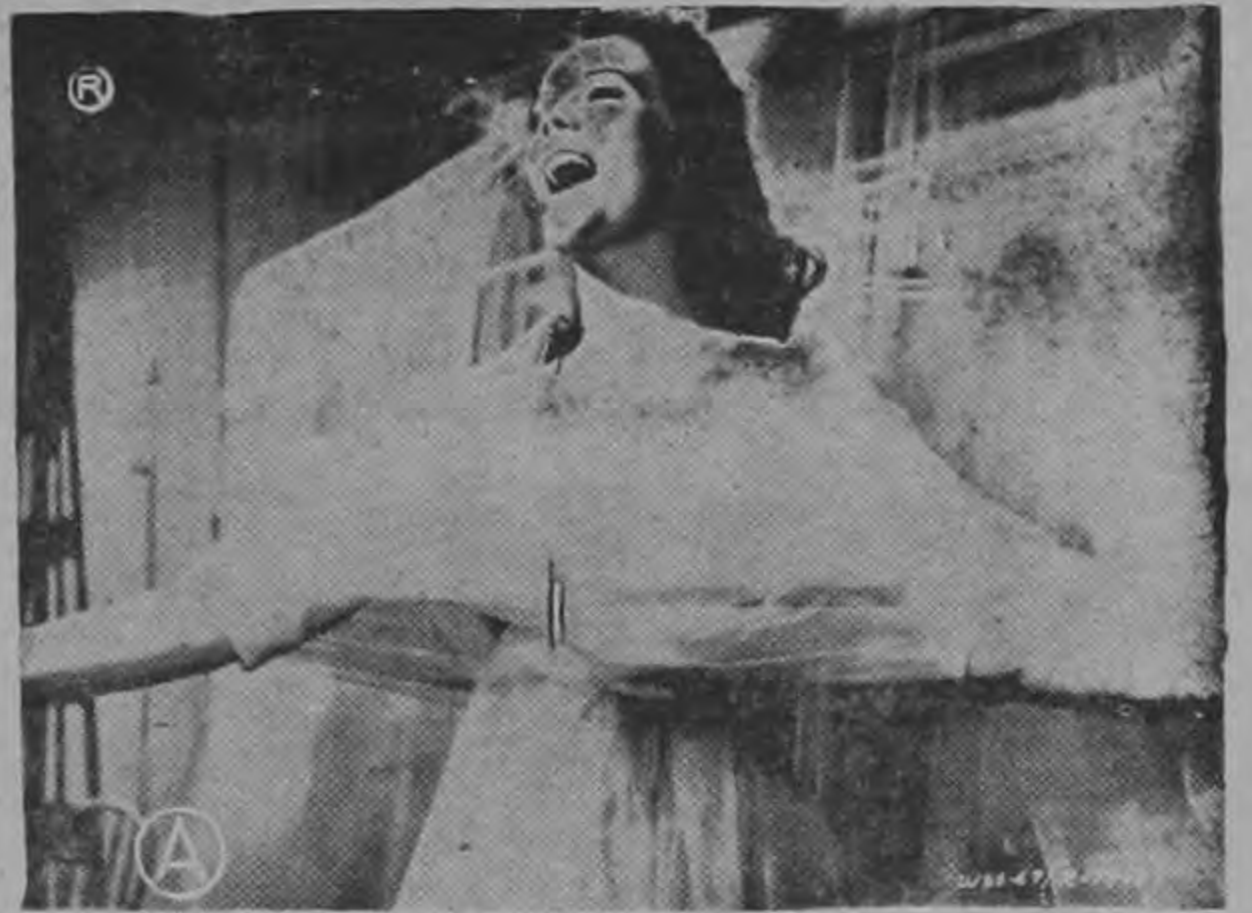
...NATALIE WOOD elegantemente vestida al estreno de una película...

Todos felices, todos contentos, menos el muy famoso doctor que con sus gestos y frases rimbombantes es llevado a un manicomio que es donde debe estar.