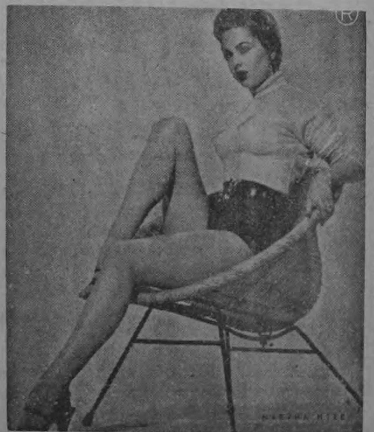
...MARTHA HYER prefiere un cuadro artístico que una lavadora...

Y para apuros los de Fernán Gómez, frente a Analia Gadé, Tony Leblenc y Laura Valenzuela en LUNA DE VERANO, divertida película en Eastmancolor y Filmascopio que, producida por Agata Films y dirigida por Pedro Lazaga, que presentará CINESPAÑA.